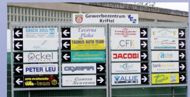
Eine von vier Info-Tafeln der VKS im Krifteler Gewerbezentrum

Mit dem Neujahrsempfang der VKS startet die Gemeinde Kriftel ins gesellschaftliche Leben des noch jungen Jahres. Hochkarätige Redner aus Politik und Wirtschaft wechseln sich ab – und es darf auch mal geschmunzelt werden. Eine regelmäßige Veranstaltung ist auch der „ Runde Tisch “ zu aktuellen Themen mit der Wirtschaftsförderung der Gemeinde Kriftel. Gesellig wird's u. a. zum VKS-Sommerfest und zur Glühweinparty . Selbständige haben trotz Stress auch Spass am Leben !