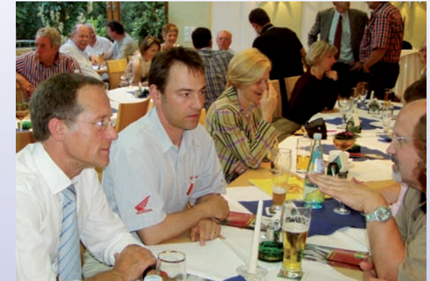
Möchten Sie uns kennen lernen, so bietet sich z.B. unser regelmäßiger Stammtisch an. Die aktuellen Termine finden sich im Internet unter vks-kriftel.de .

1950 gegründet , ist es die Aufgabe der VKS, die Wirtschaftskraft der Selbständigen und Gewerbetreibenden mit Sitz in Kriftel zu fördern. Den Bürgern soll ein lückenloses Angebot an Waren und Dienstleistungen in ihrem nahen Umfeld zur Verfügung stehen. Arbeitsplätze sollen in Kriftel gesichert und neu geschaffen