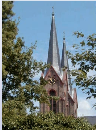
Wunderschöne Gemeinde mit viel Tradition

Sie wissen, warum. Eine Interessenvertretung, im Ort – vor Ort ist heutzutage wichtiger denn je.“